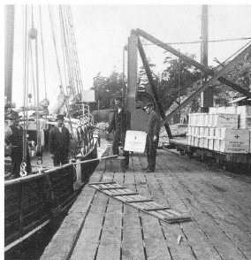
Dynamitlastning på segelskuta.