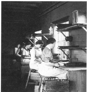
Interiör från dynamitinslagningshuset där de färdiga dynamitpatronerna slås in i paraffinerat papper.