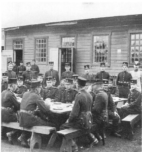
En kontingent ur Kgl Svea Ingenjörskåren som under strejken 1909 användes som vaktpersonal framför matsalsbyggnaden.